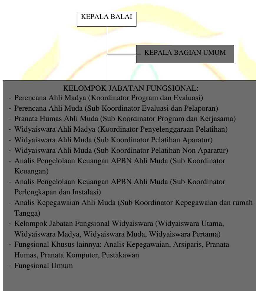
Gambar 1. Struktur Organisasi BBPP Lembang

Secara skematis susunan organisasi BBPP Lembang dapat dilihat pada Gambar 1 .